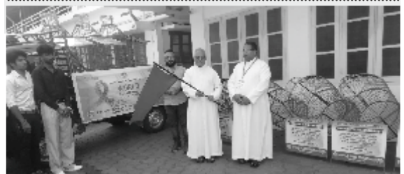
പ്ലാസ്റ്റിക് ബോട്ടിൽ കളക്ഷൻ ബൂത്തുകൾ സ്ഥാപിച്ചു