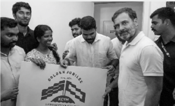
കെ.സി.വൈ.എം. സുവർണ്ണ ജൂബിലി ലോഗോ പ്രകാശനം ചെയ്തു

കെ.സി.വൈ.എം. വരാപ്പുഴ അതിരൂപതയിൽ ആരംഭിച്ചതിന്റെ സുവർണ്ണ ജൂബിലി ആഘോഷങ്ങൾക്ക് തുടക്കമായി. സുവർണ്ണ ജൂബിലി ആഘോഷങ്ങളുടെ